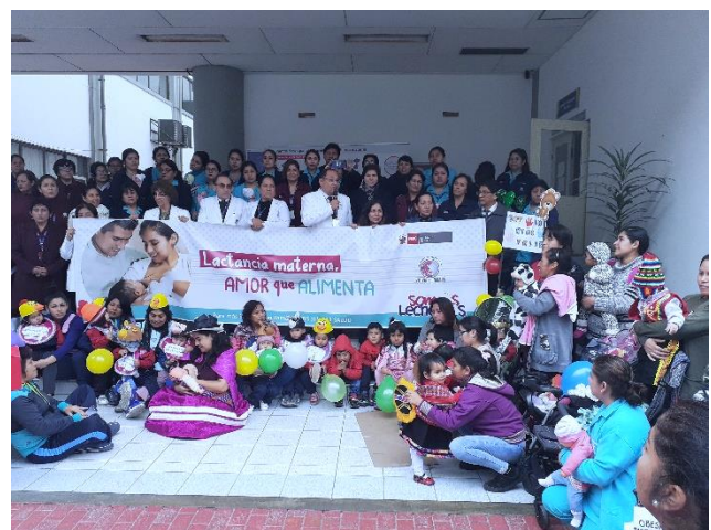
Figura 2. Ejecución del pasacalle: Actividades de concienciación, participación del personal de salud y población gestante