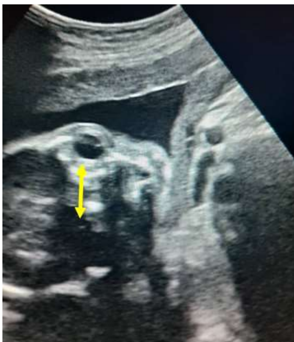
Nótese el hipertelorismo (flecha amarilla)